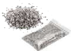
Speciaal granulaatsplit 0,50 kg Art.-Nr. 21823