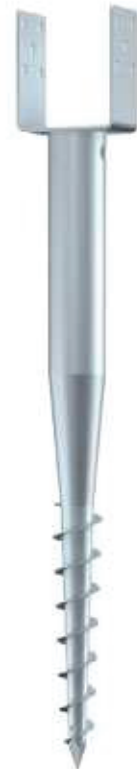
KSF U 66x 730-111

Indraaistang kort 0,60 kg Art.-Nr. 20070