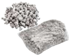
Speciaal granulaatsplit 1,50 kg Art.-Nr. 21824