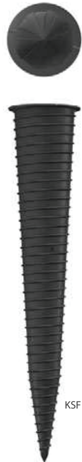
KSF K 60x800